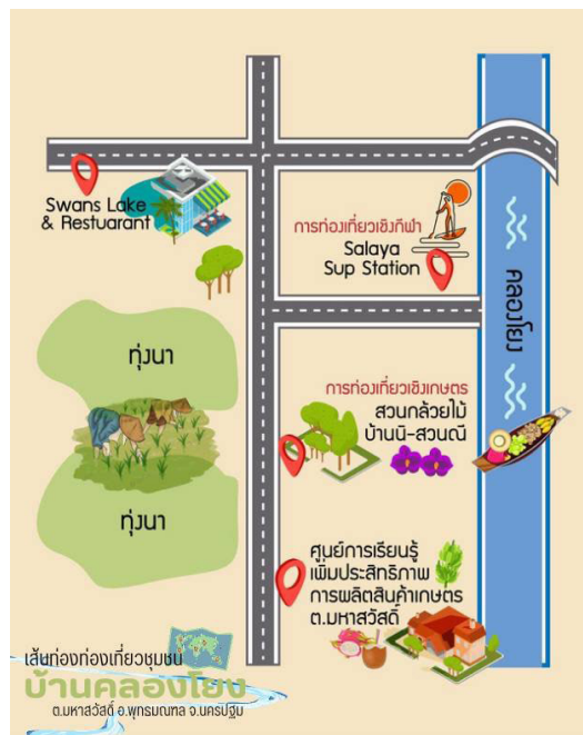
ภาพที่ 2 เส้นทางท่องเที่ยวชุมชนบ้านคลองโยง

2.5 Salaya SUP Station บ้านสวนริมคลองโยง กิจกรรมนันทนาการและกีฬาที่กำลังได้รับความนิยมจากนักท่องเที่ยวสายผจญภัยกับกีฬาทางน้ำรูปแบบใหม่ ได้รับการพัฒนามาจาก Surf Board โดยเพิ่มไม้พายเข้ามาเป็นอุปกรณ์ที่ช่วยให้สามารถเคลื่อนที่ไปโดยไม่ต้องอาศัยคลื่นเพียงอย่างเดียว จึงสามารถเล่นได้ทุกที่ เป็นการออกกำลังกายได้อย่างมีประสิทธิภาพโดยใช้กล้ามเนื้อทุกสัดส่วนตั้งแต่หัวจรดเท้า เฝ้ามลลางพลังงานได้อย่างดี